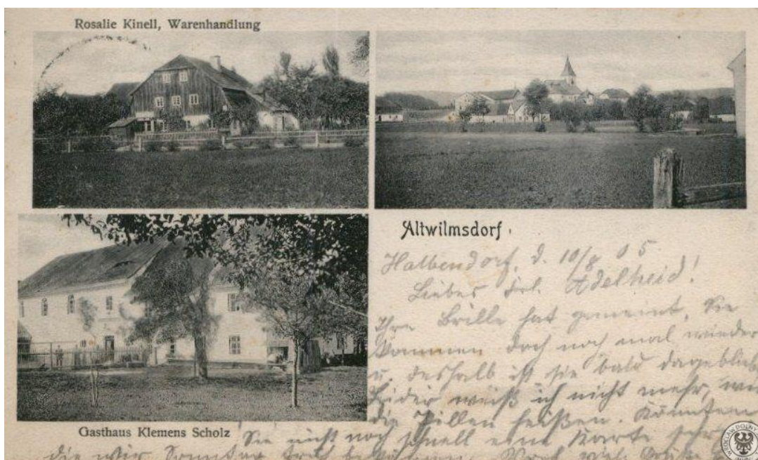
Fot. 8 Kartka pocztowa obrazująca wieś Altwilmsdorf (późniejszy Stary Wielisław)

W czasie II wojny światowej wieś nie ucierpiała. Po wojnie, dzięki dobremu położeniu nastąpił rozwój wsi, a przy źródle wody mineralnej powstała rozlewnia, butelkująca wodę mineralną. Kościół przejęli ojcowie sercanie, mający swą siedzibę w Sokołówce 10 .